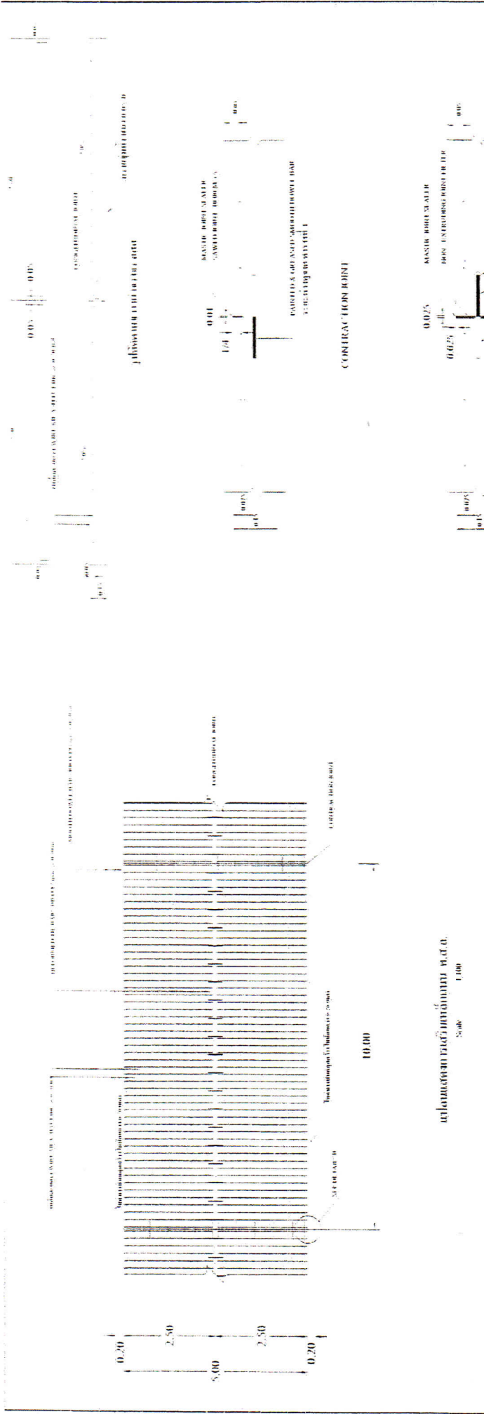
รูปที่ 13-1 มาตรฐานแบบเสริมคอนกรีตที่ใช้ภายในคานและเสา