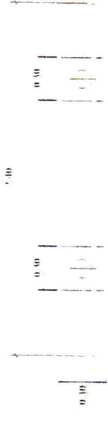
รูปแปลนแสดงรายละเอียดที่ 1 ของการหลังดาดบ้าน Scale 1:25